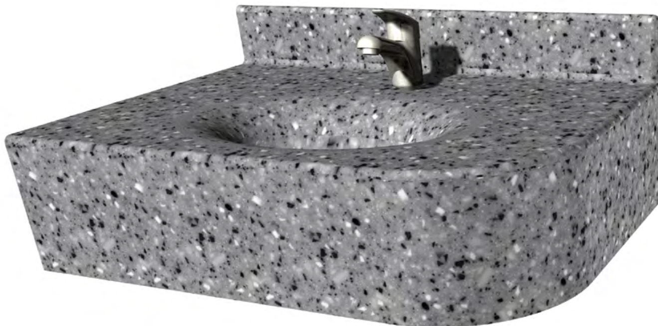
Plan thermoformé avec ceinture et dossieret à congé