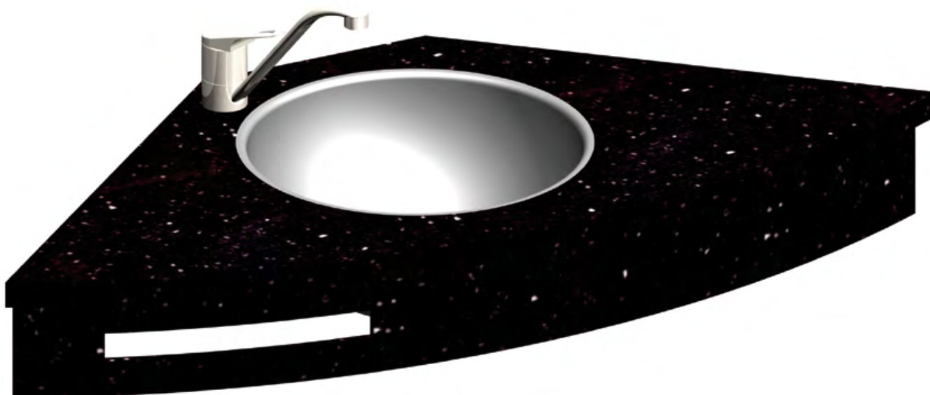
Plan en forme avec ceinture et vasque intégrée par dessous sans joints