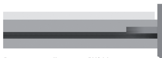
Rive anti-ruissellement en PVC blanc