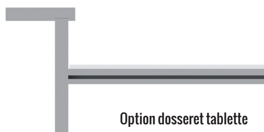
Option dosseret tablette