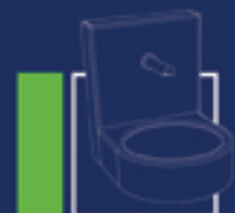
RÉSINE DE SYNTHÈSE ACRYLIQUE