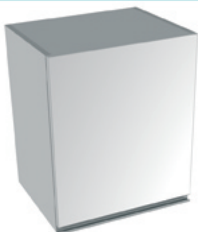
Meuble haut suspendu une porte battante