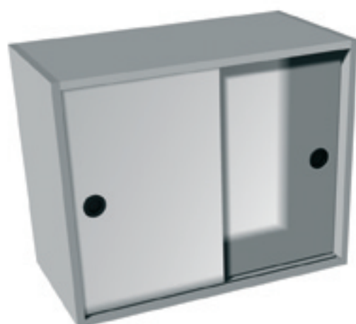
Meuble haut suspendu avec portes coulissantes