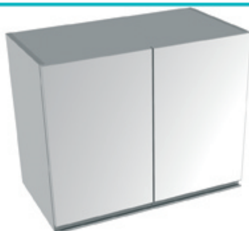
Meuble haut suspendu deux portes battantes