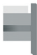
Rive standard en PVC blanc