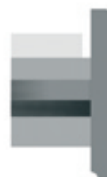
Rive anti-ruissellement en PVC blanc