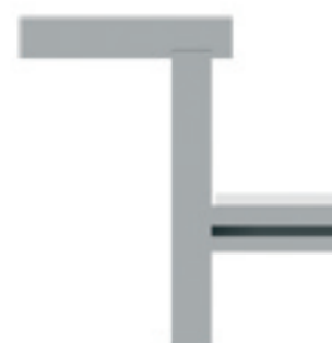
Option dossier tablette